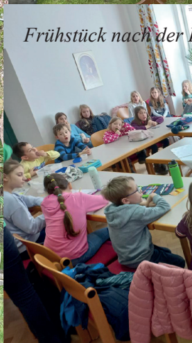
Frühstück nach der...