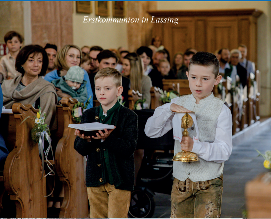
Erstkommunion in Lassing