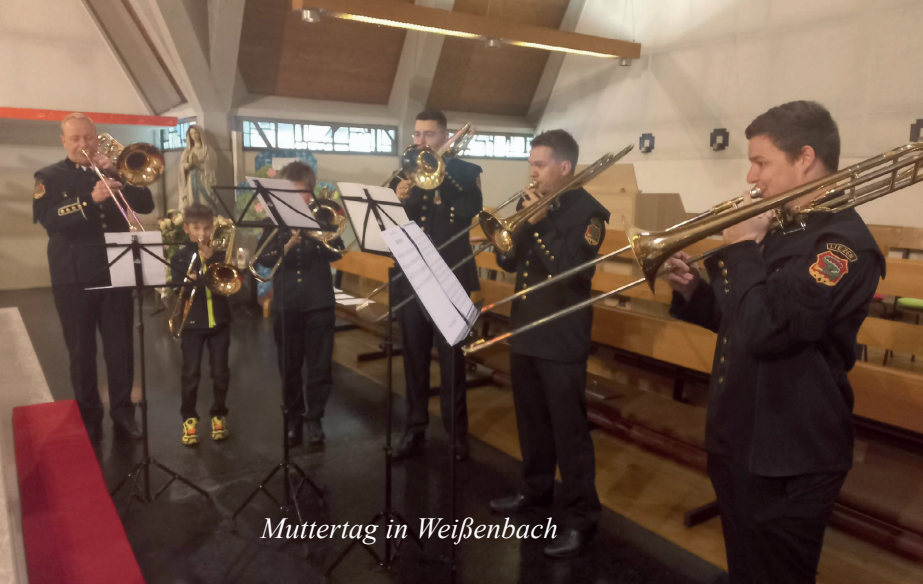
Muttertag in Weißenbach