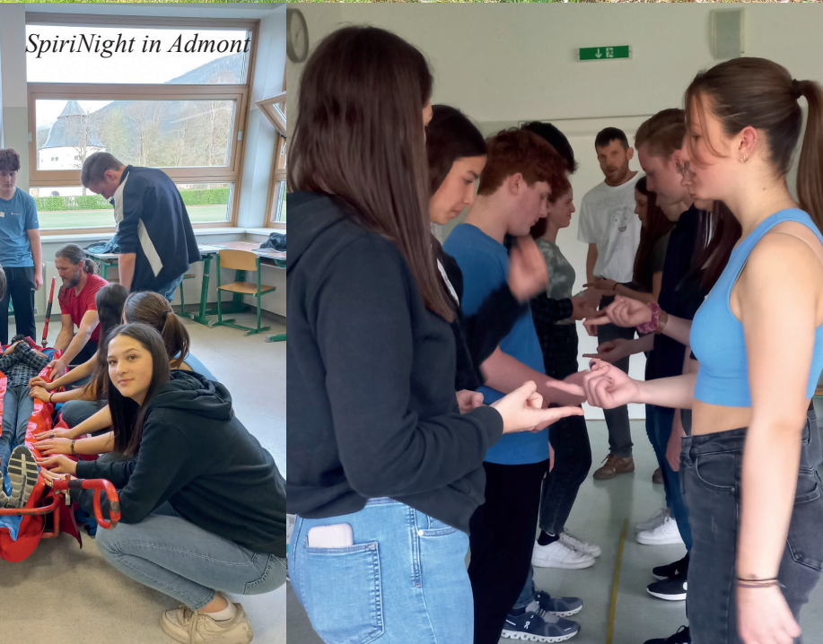
SpiriNight in Admont