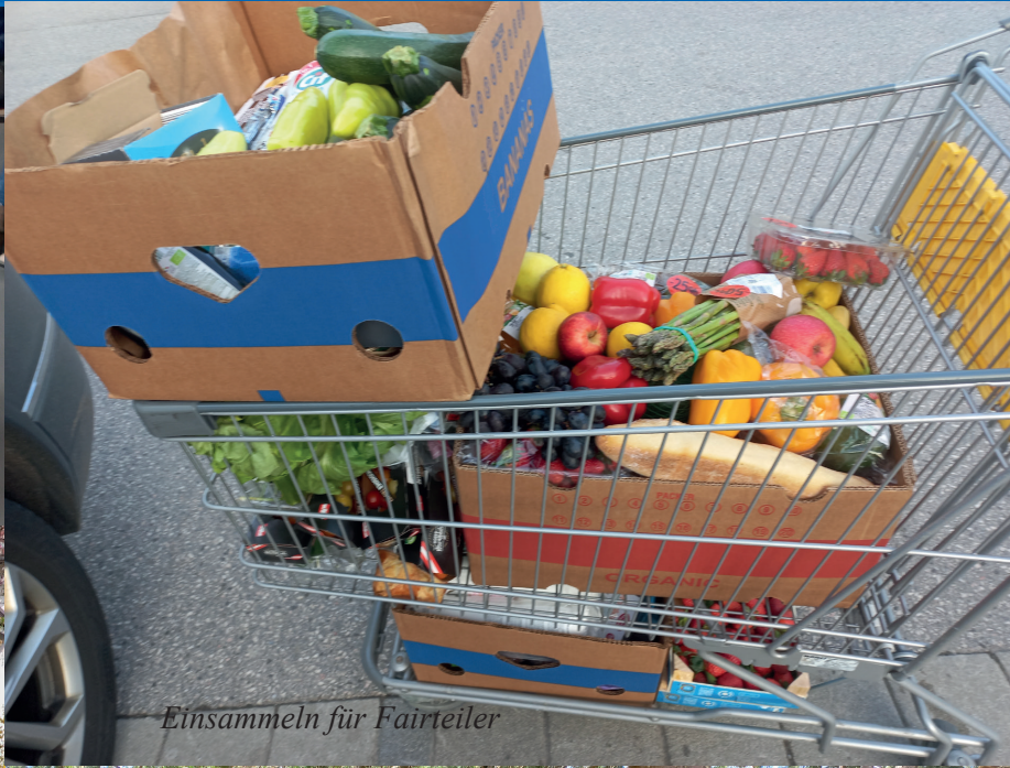
Einsammeln für Fairteiler