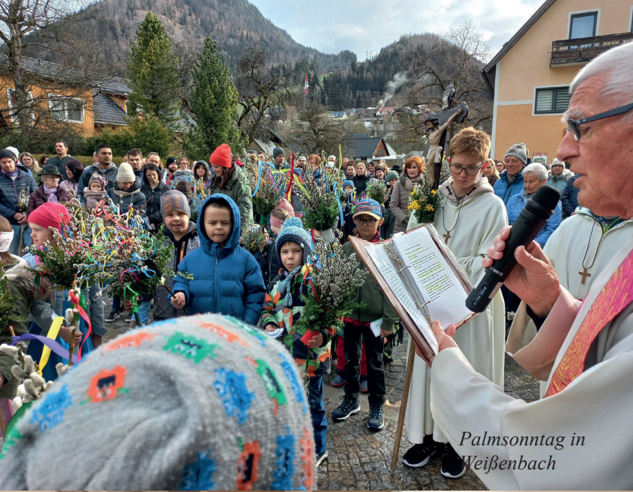
Palmsonntag in Weißenbach