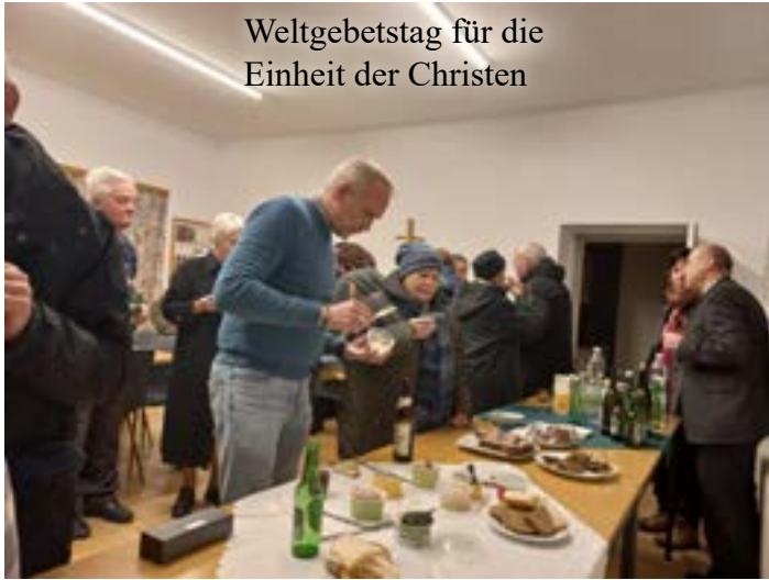
Weltgebetstag für die Einheit der Christen