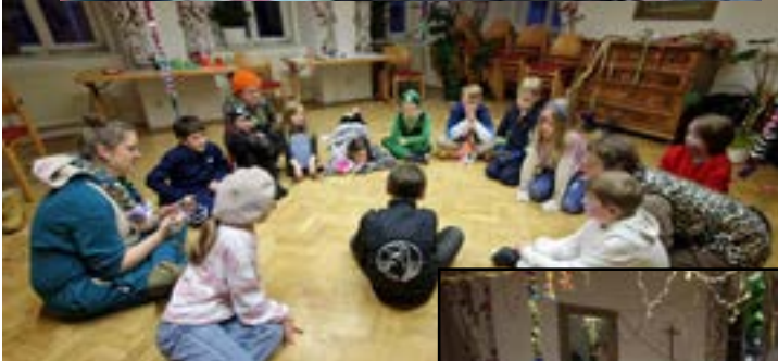
Auch in der Pfarre feierten wir den Fasching