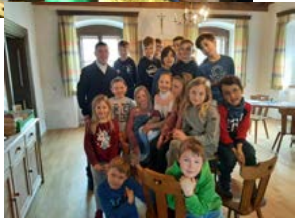
Vorstellgottesdienste in Liezen, Lassing und Weißenbach