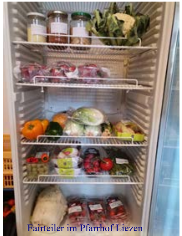
Fairteiler im Pfarrhof Liezen