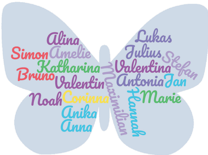
Unsere Erstkommunionkinder aus Lassing

Liebe Kinder, wir wünschen euch allen eine wunderschöne Zeit der Vorbereitung und freuen uns sehr darauf mit euch gemeinsam das besondere Fest der Erstkommunion zu feiern.