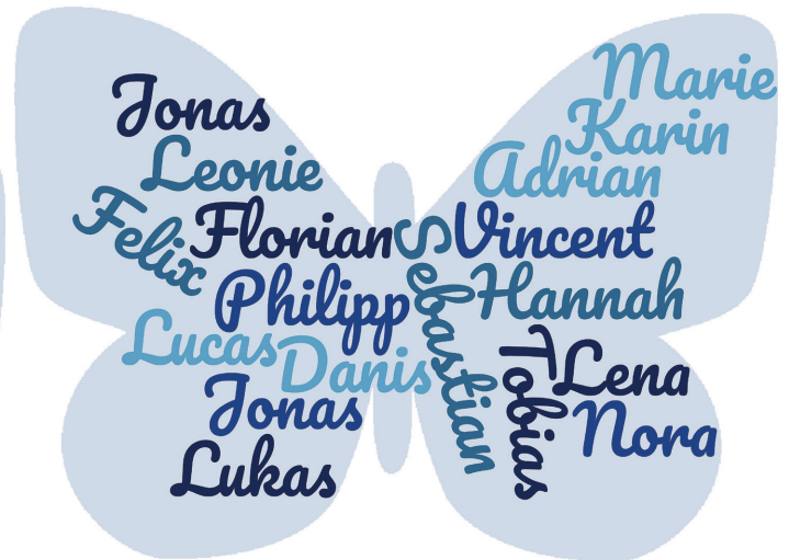
Unsere Erstkommunionkinder aus Weißenbach