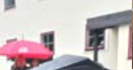
Nacht der Tausend Lichter