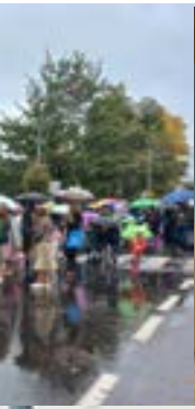
Minifest in Admont