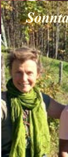
Lesung von Bischof Glettler