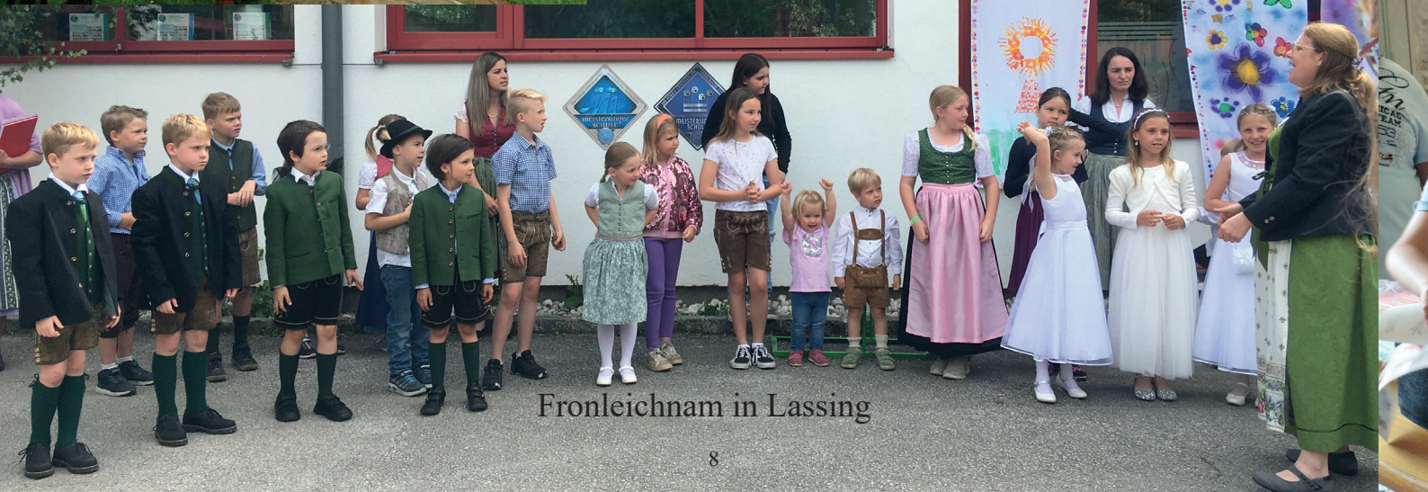
Fronleichnam in Lassing