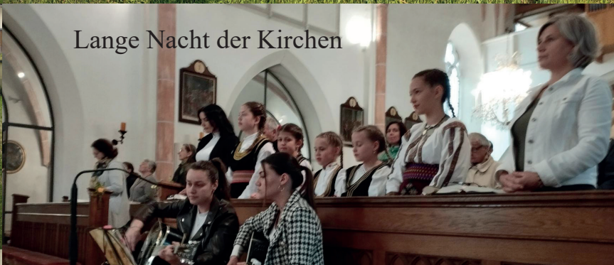
Lange Nacht der Kirchen