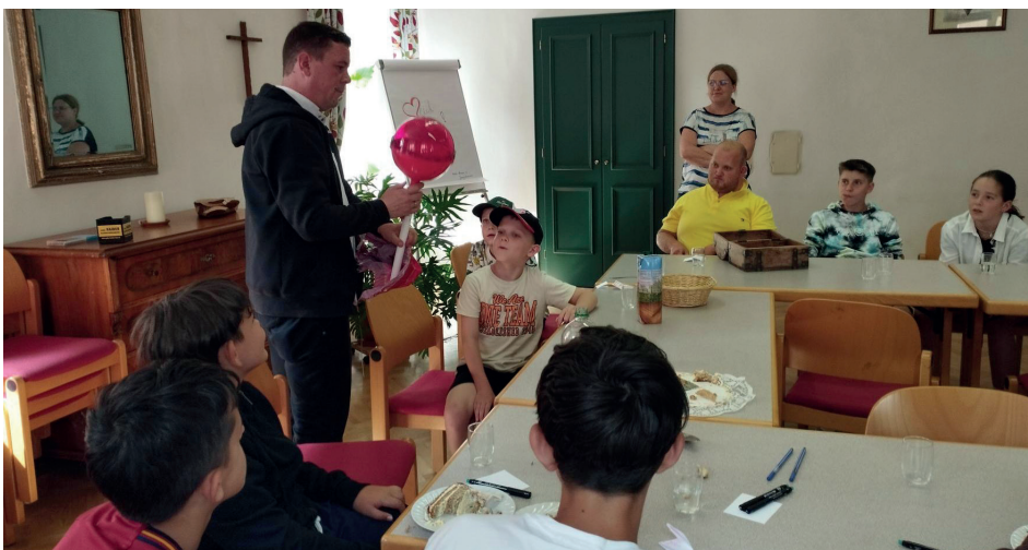
Die Ministranten gratulieren und feiern mit unserem Hr. Pfarrer

Ein herzliches Danke an alle, die ihren großen oder kleinen Beitrag dazu leisten.