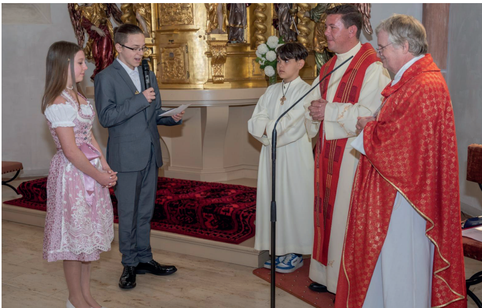
Dank der Firmlinge an den Firmspender